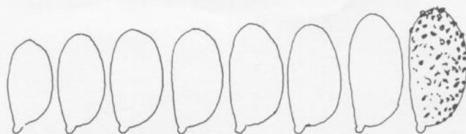
spores de la récolte figurée

Iconographie: Fries, icônes inédites. Moyennes. Non Quelet, non Ricken, non Cooke, non Lange, non Marchand (1799).