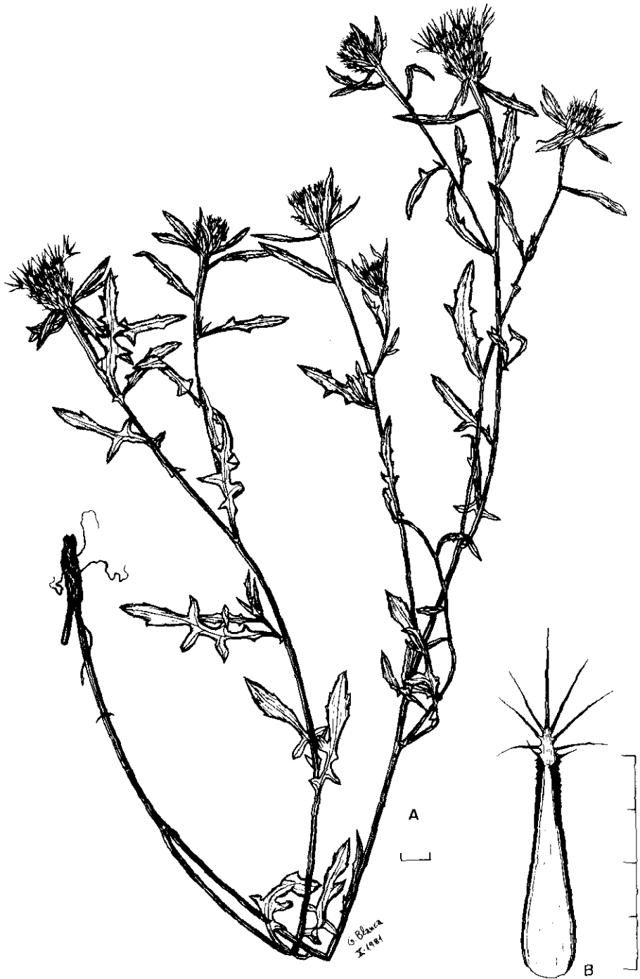
Fig. 1. — Centaurea x hurtadoi G. Blanca: A. Porte general; B. Bráctea involucral media.