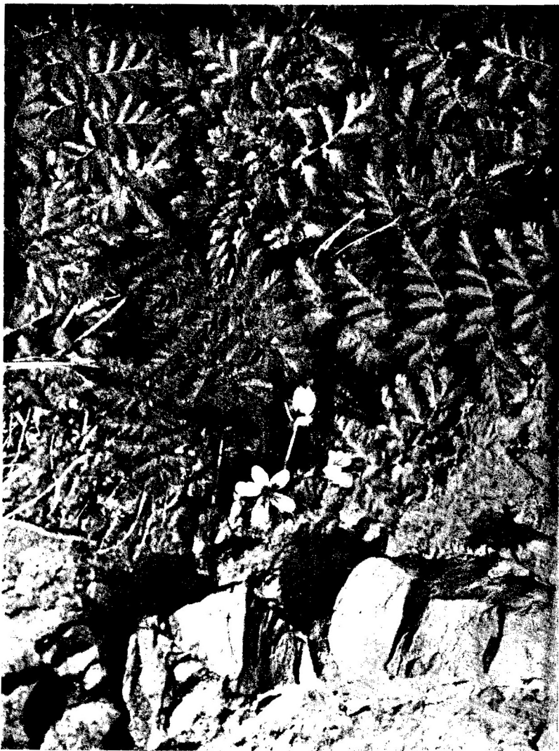
PHOT. 1. — Aspect de l' Erodium gaussenianum en hiver (20-II-72) sur une grande fente de la falaise, 760 m d'altitude. (Phot. Claude DENDALETCHÉ).

(sine mucrone) et 4 mm latis, in fructificatione acrescentis cum margine vix membranoso et a mucrone crasso terminatis. Petalis pallide-roseis vel albescentis nervoso-violaceis, inaequalibus (9-12 × 7-9, rrr. 15 × 9 mm) calice subduplo longioribus, duis superioribus magis nigro-violaceo maculatis et tria inferioribus parcissime nervoso maculatis; omnibus unguiculatis (ca. 2 mm) et vix piloso-pectinatis.